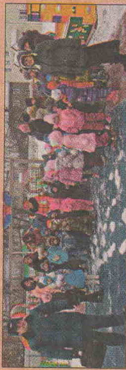
Учения прошли в штатном режиме