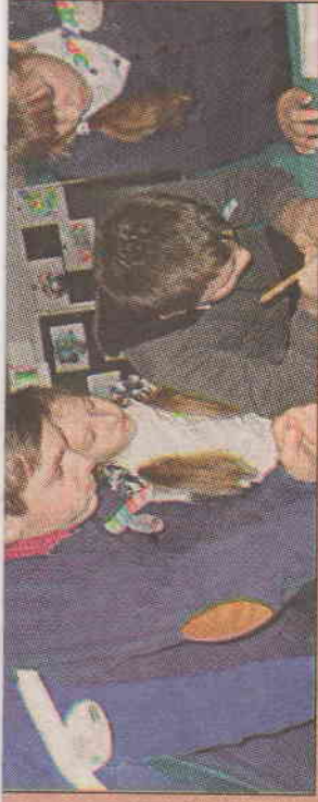
Решение трудного задания