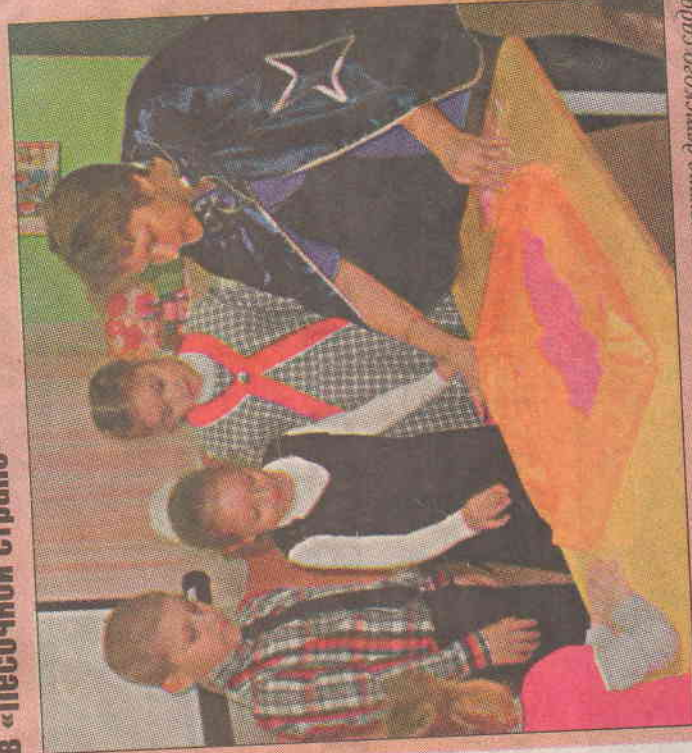
Понастать в сказку можно и в группе детского сада

Козловские дошкольники побывали в «Песочной стране»